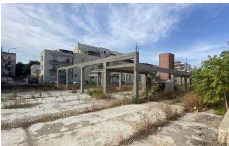
Ex Cottonificio, "casa del custode" occupata sine titolo, emessa ordinanza di sgombero